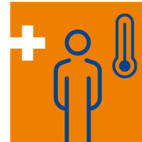
Bei Unwohlsein Arzt aufsuchen